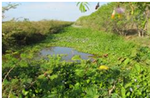
Fig. 1. Estado de los canales de riego y drenaje.

La falta de mantenimiento de la red de drenaje (Fig. 1) es un problema existente donde en algunos casos cambia su condición de drenaje para convertirse en una fuente recargable del nivel freático.