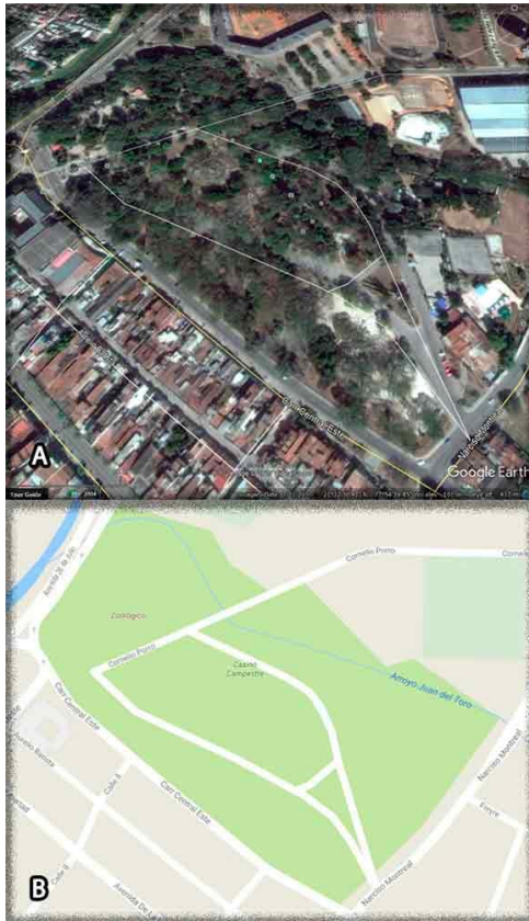
Fig. 2. Ubicación y distribución del parque Casino Campestre. (A) Ortofoto.