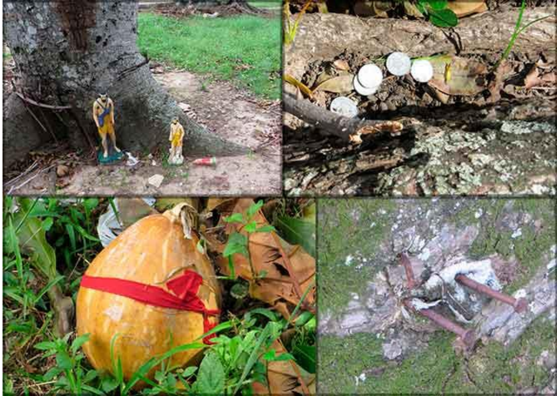
Fig. 7. Ofrendas relacionadas con ritos de religiones afro-cubanas, depositadas junto a los troncos de Ceiba pentandra en el Casino Campestre.

frecuentemente bajo el follaje de Ceiba pentandra , árbol con especial significado en el contexto de los complejos procesos de transculturación que han nutrido la cultura cubana (Fig. 7). En resumen, el Casino Campestre ocupa, desde hace mucho tiempo, una posición cimera en la espiritualidad de los camagüeyanos y, por tanto, funciona como un elemento de gran relevancia en los procesos que generan su identidad.