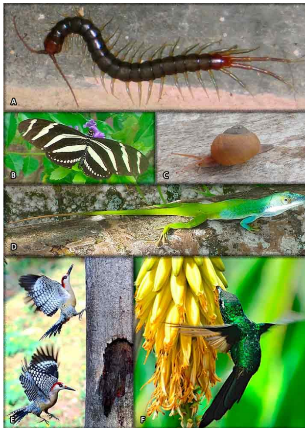
Fig. 6. Algunas de las especies de animales representadas en el parque. (A) Scolopendra alternans . (B) Heliconius charithonia ramsdeni . (C) Zachrysis auricoma . (D) Anolis allisoni . (E) Melanerpes superciliaris superciliaris . (F) Chlorostilbon ricordii .

La fauna silvestre se caracteriza por su diversidad. Estudios preliminares realizados por los autores del presente artículo, han corroborado la existencia de 85 especies y 34 subespecies, correspondientes a los phyla: Mollusca, Annelida, Arthropoda y Chordata. Los grupos mejor representados son: los insectos, entre los cuales predominan los lepidópteros, en particular las mariposas diurnas (Rhopalocera). La mayor parte de estos animales están adaptados a la convivencia con el hombre y aparecen frecuentemente en la ciudad, tal es el caso de algunos moluscos ( Zachrysis auricoma ), mariposas diurnas ( Anartia jatrophae guantanamo , Heliconius charithonia ramsdeni ), quilópodos ( Scolopendra alternans ), anfibios ( Eleutherodactylus planirostris ), reptiles ( Anolis allisoni ) y aves ( Chlorostilbon ricordii ). No obstante, otros como el ave Melanerpes superciliaris superciliaris , cuyo hábitat natural ha sido tradicionalmente en los bosques, se han refugiado en el parque al verse obligados a migrar a la ciudad, como alternativa ante el avance de la deforestación (Fig. 6).