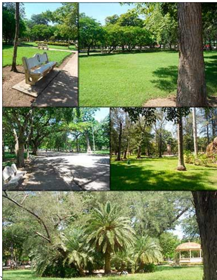
Fig. 5. Aspecto de la vegetación en el parque Casino Campestre, vista desde diferentes posiciones.

como es lógico, no han sido estables a lo largo de la historia del Casino Campestre, sino que, por el contrario, han estado sometidas a fluctuaciones provocadas por múltiples causas, entre las cuales merecen destacarse las afectaciones que han causado los huracanes e inundaciones que han afectado el área, las reformas arquitectónicas y constructivas a que ha sido sometido el parque a lo largo de su historia y la disponibilidad de recursos que ha existido en diferentes momentos. A todo ello habrá que agregar, a partir de ahora, las afectaciones que se esperan como consecuencia del cambio climático.