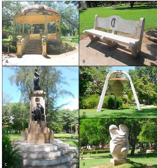
Fig. 3. Elementos constructivos relevantes en el parque. (A) Glorieta. (B) Modelo del mobiliario actual. (C) Monumento a Salvador Cisneros Betancourt (1828-1914), Marqués de Santa Lucía, dos veces Presidente de la República en Armas, entre otros múltiples méritos. (D) Monumento alegórico a la Campaña de Alfabetización realizada en 1961 (un palomar que reproduce la forma de los faroles utilizados por los jóvenes alfabetizadores para iluminar los espacios en que impartieron las clases). (E) Monolito alegórico a la paz.

Importantes instalaciones ubicadas en el entorno inmediato al Casino Campestre, complementan su notoriedad. Entre otras, merecen ser destacadas: la Plaza de la Revolución “Mayor General Ignacio Agramonte”, la Sede de la Asamblea Provincial del Poder Popular, el estadio de Baseball “Candido González”, el Palacio de los Deportes “Rafael Fortún Chacón”, el Complejo Deportivo “Patricio Lumumba”, el Complejo Cultural Recreativo “Casino Campestre”, el Instituto Preuniversitario “Álvaro Morell Álvarez” y el Auditorium “Iván Hidalgo Funes”.