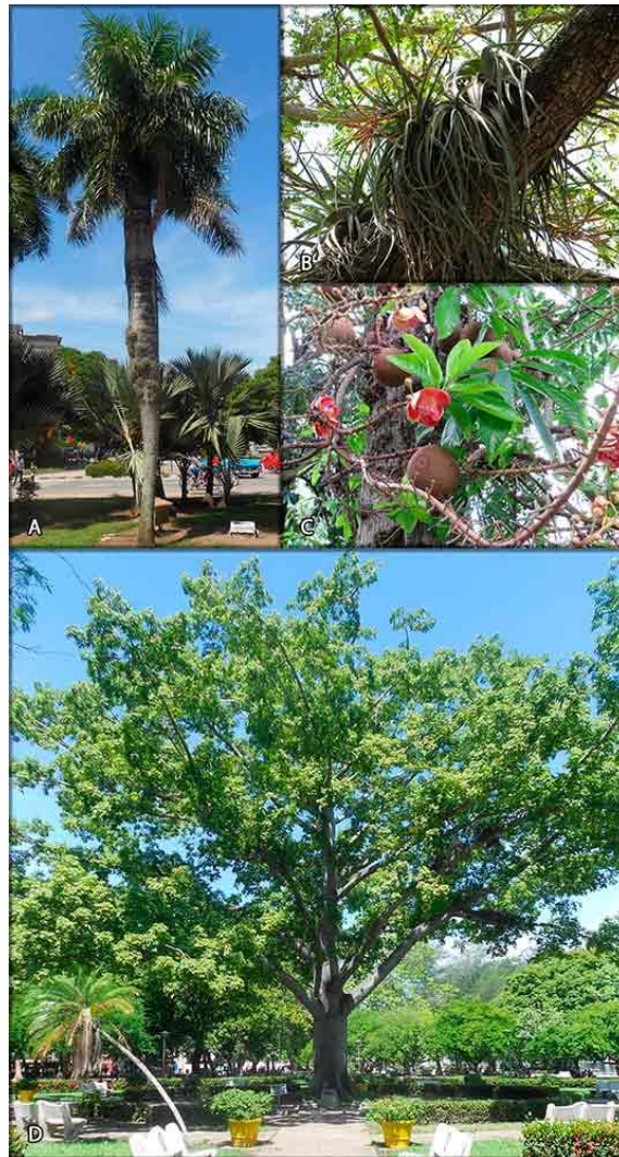
Fig. 4. Algunas de las especies vegetales representadas en el parque. (A) Ejemplares de palmas. En primer plano: Acrocomia crispera (con representantes epífitos de Tillandsia recurvata creciendo en el tronco); al fondo y más pequeña: Latania loddigesii . (B) Tillandsia balbisiana creciendo sobre ramas de Samanea saman . (C) Couroupita guianensis . (D) Ceiba pentandra .

El estudio realizado permitió confirmar la presencia en el Casino Campestre de 198 especies, pertenecientes a 170 géneros y 72 familias de Embryophytes (Fig. 4). En el Anexo 1 puede apreciarse una relación completa de los mismos, en la cual se incluyen tanto los taxones que han sido introducidos allí por el hombre (67 %), como los que crecen espontáneamente (33 %).