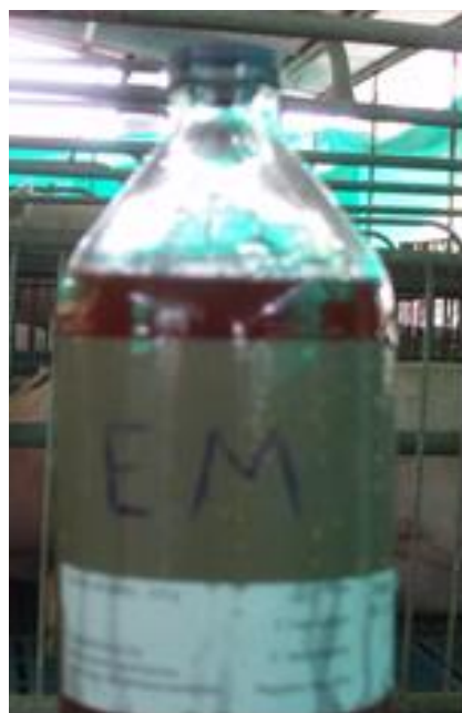
Fig. 3. Microorganismos Eficientes

Selección de los animales. Se utilizaron un total de 72 cerdos en la categoría de crías, provenientes de cruces de hembras Yorskhire y sementales Landrace, hembras y machos castrados, en igual proporción.