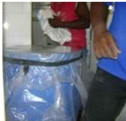
Fig. 2. Depósito de elaboración del ME.

olor a vino, sabor dulce y ligeramente salado con pH de 3,4.