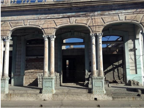
Fig. 6: Edificio ubicado en la zona de estudio (calle Lucas Ortiz).