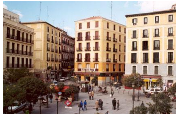
Fig. 2 Viviendas rehabilitadas en Madrid.

A nivel nacional tenemos La Habana Vieja (Fig.3) y Camagüey (Fig.4) como exponentes relevantes de proyectos tanto urbanos como arquitectónicos, que se han llevado a cabo para la conservación de sus centros históricos.