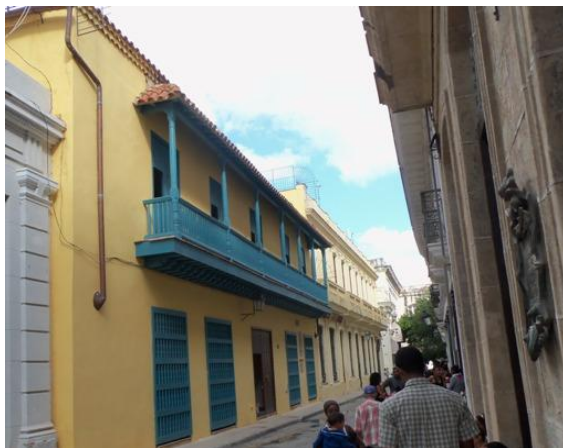
Fig. 3 Viviendas rehabilitadas en La Habana Vieja.

A nivel nacional tenemos La Habana Vieja (Fig.3) y Camagüey (Fig.4) como exponentes relevantes de proyectos tanto urbanos como arquitectónicos, que se han llevado a cabo para la conservación de sus centros históricos.