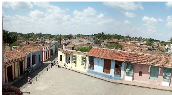
Fig. 4 Viviendas rehabilitadas en Camagüey.