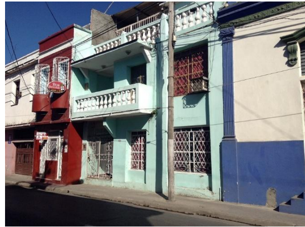
Fig. 7: Vivienda ubicada en la zona de estudio (calle Lucas Ortiz).