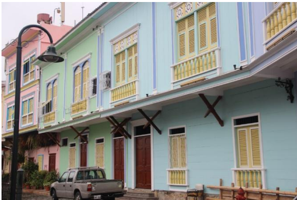
Fig. 1 Viviendas rehabilitadas en Quito.

Existen importantes ejemplos donde se han dedicado recursos a la preservación de los bienes patrimoniales para la conservación de sus centros históricos y de su hábitat. Entre ellos tenemos la ciudad de Quito, Ecuador (Fig.1) y la de Madrid, España (Fig.2); los esfuerzos hechos en ambos centros metropolitanos para revertir la difícil situación que ostenta el hábitat en esas localidades, con la puesta en marcha de programas de rehabilitación que subvencionan intervenciones en viviendas con población de escasos recursos económicos y la recuperación del patrimonio, son un patrón a seguir dentro de este tipo de procesos, como recurso para mejorar las condiciones de vida de la población.