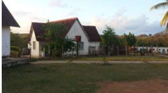
Fig. 3 Viviendas del Pueblito Holandés

Reunió a los habitantes de Turiguanó y habló de crear la primera brigada guerrillera de producción, que trabajaría en la construcción de bebederos para el ganado, así como en la construcción de 48 viviendas, una escuela primaria y una farmacia. Estas viviendas se construyeron con el fin de mejorar las condiciones de vida y unificar las familias que vivían en la isla y que tenían como principal fuente de empleo la fabricación de carbón y el cuidado y reproducción del ganado, introducido en la zona por Míster Barker en 1935 con los primeros 35 ejemplares, lo cual convirtió a Turiguanó en uno de los reductos ganaderos cualitativamente más importantes de América Latina y el mundo, donde se logró casi la pureza de la raza Santa Gertrudis.