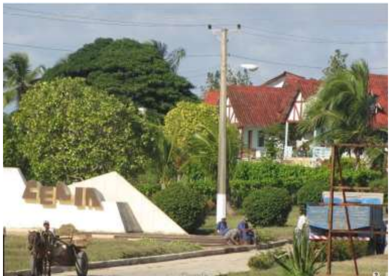
Fig. 4 Entrada al pueblo, con su nombre oficial.

Tiempo después, convertida la cayería norte de la provincia en uno de los destinos turísticos más importantes del país, se comenzaron a incluir paseos por Turiguanó como parte de paquetes extra hoteleros, con el fin de observar caballos de pura raza, ganado Santa Gertrudis y también visitar el peculiar Pueblo Holandés, reconocido por su rara belleza y tipología arquitectónica. De esta forma se incrementaron los servicios hoteleros, que han sido un eslabón débil en el turismo de la provincia hasta nuestros días.