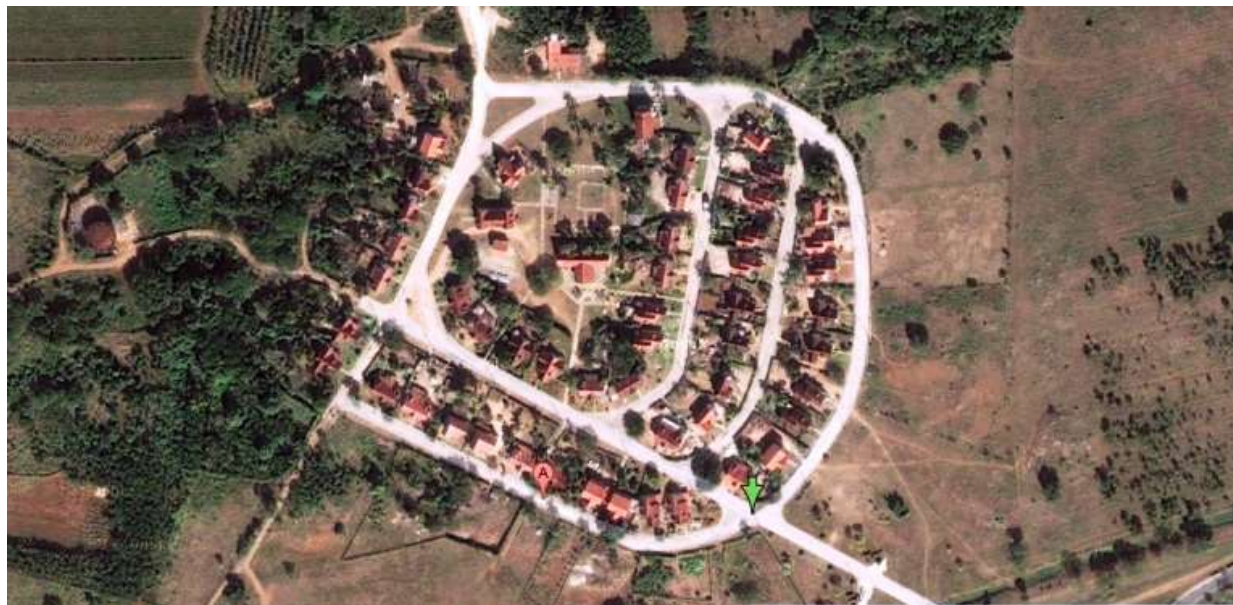
Fig. 2 Vista aérea del Pueblo Holandés Fuente: Google Earth. Febrero 26, 2016

Han transcurrido 51 años, y se ha desarrollado un gran polo turístico con hoteles modernos de cuatro y cinco estrellas en Cayo Coco y Cayo Guillermo, unidos mediante pedraplenes a Turiguanó, que constituye su vínculo obligado, por carretera, con nuestra isla principal. El Pueblo Holandés, muy deteriorado por la agresividad del medio, el escaso trabajo de mantenimiento y otras causas, necesita con urgencia un tratamiento integral que incluya desde las indispensables reparaciones, hasta la adecuación de sus funciones a las nuevas necesidades impuestas por el entorno.