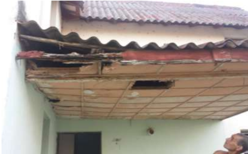
Fig. 6 Ejemplo de deterioro en techo

La conservación sostenible de este poblado tiene importancia social y económica, ya que al mejorar la calidad de vida en sus habitantes se favorece una mayor permanencia de los mismos en la isla, lo que apoya la estrategia económica de la Empresa Pecuaria y fortalece la economía de la provincia tanto en el renglón ganadero como en el turístico.