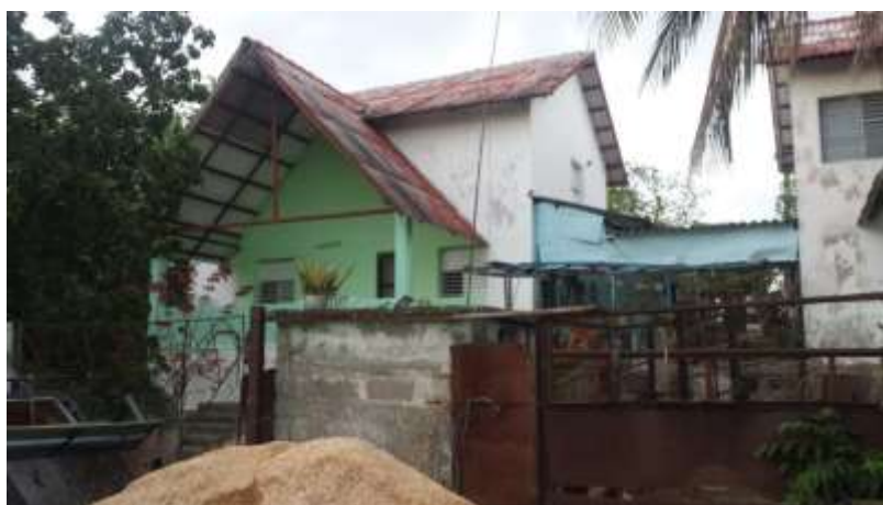
Fig. 5 Ejemplo de deterioro en viviendas.

En 1983 la organización alemana “Pan para el Mundo” donó, a la Isla de Turiguanó, dos molinos eólicos con el objetivo de obtener electricidad de forma natural, y la planta más grande de América Latina para la obtención de gas a partir del estiércol de vaca, que fue ubicada en el mismo Pueblo Holandés y es conocida como “Vacugas”. Debía producir gas gratuito para el consumo de las viviendas del poblado, lo que se cumplió durante dos años. Sin embargo, la falta de mantenimiento de la planta generó anomalías en la obtención y uso del gas, que causaron deterioros de los elementos metálicos y electrónicos de las viviendas. Además, se mancharon los muros mientras que los enchapes en paredes y pisos perdieron su terminación. Esto aceleró el deterioro del pueblo, que se incrementó debido a la falta de mantenimiento constructivo, lo que a su vez puede relacionarse con las condiciones económicas de sus habitantes, quienes en su totalidad eran campesinos con escasos recursos financieros.