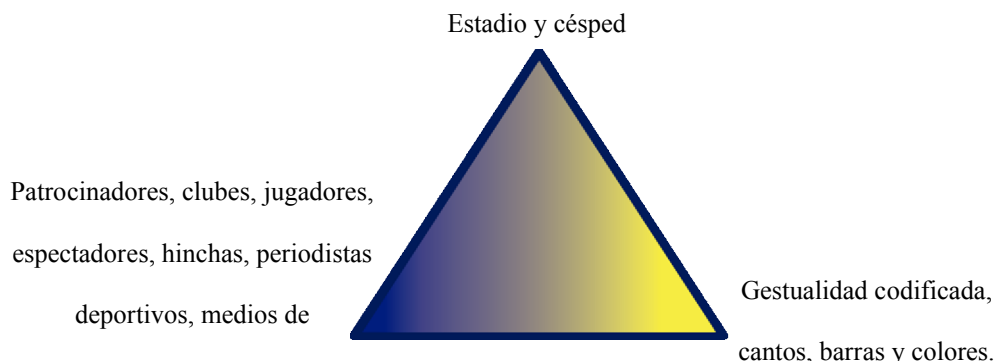
Fig. 2: Triada de componentes antropológicos particulares del fútbol.

Al comparar los componentes de la triada que se muestra en los resultados (ver fig. 1) junto a las interpretaciones realizadas a partir de los resultados obtenidos con las observaciones, se puede mostrar una gran diferencia. Estas están dadas porque a partir de los resultados y posterior interpretación de los mismos se puede llegar a un mayor de síntesis y singularidad en el fútbol. Como resultado de dicha síntesis se tienen tres elementos fundamentales: estadio y césped (como lugar sagrado), los patrocinadores, clubes, jugadores, hinchas, periodistas deportivos, medios de comunicación (como luchas tribales) y la gestualidad codificada, los cantos, las barras, los colores (como lo cultural y ritual). Como resultado de la interpretación emerge una nueva triada con componentes antropológicos propios del fútbol (ver fig. 2).