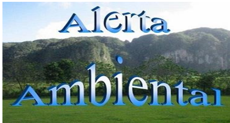
Figura 2. Primera ventana con el título del producto.

Estos documentos a su vez tienen un link que los enlaza a la ficha técnica que está dentro de uno de los archivos elaborados según tipo de documento seleccionado, donde se muestra la descripción física del documento (autor, título, palabras claves, etc.) así como el resumen de cada material. Si algún trabajo es de su interés da clic en [a texto completo], que los llevará al archivo que contiene el documento (Figura 5 y 6).