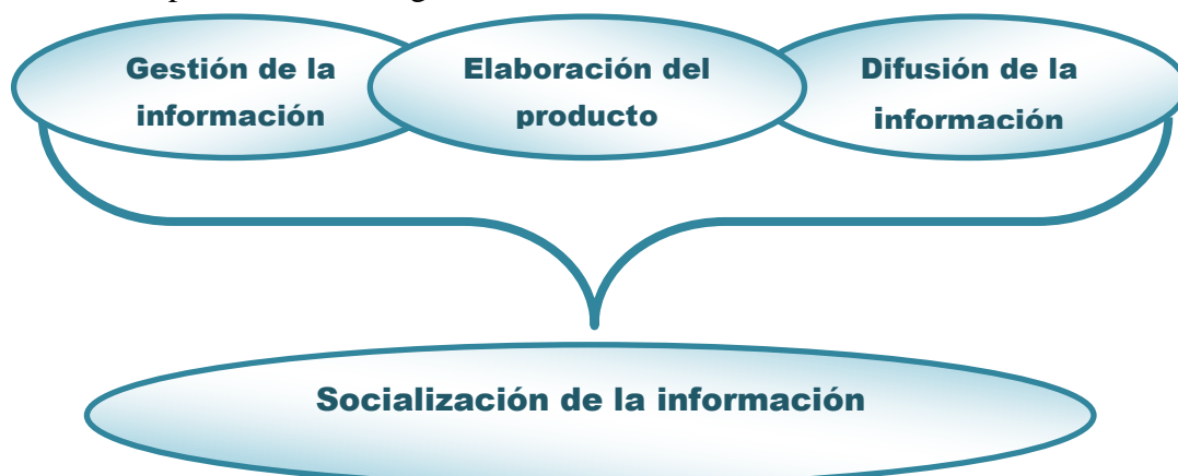
Figura 1. Triada para elaborar un producto informativo desde la biblioteca universitaria con el uso de las TIC.

Partir del cumplimiento de la siguiente triada: