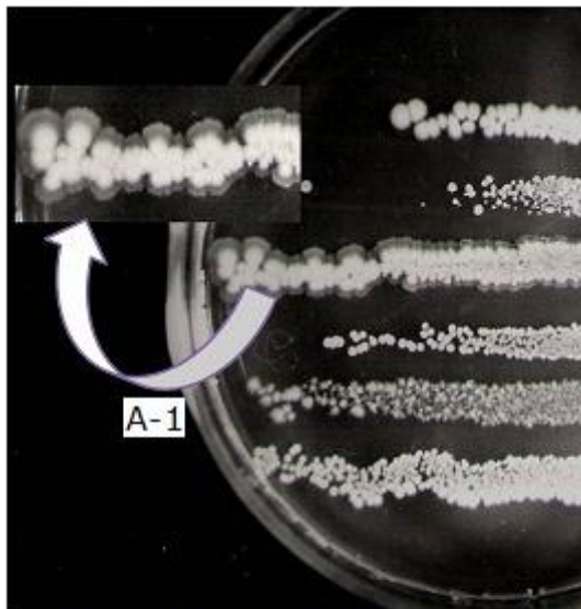
Fig. 2. Formación de exopolisacáridos en torno al crecimiento de A-1. La zona mucoide se incrementa a medida que aumenta la concentración del cobre.