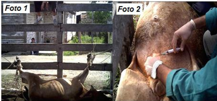
Fig. 1. Inmovilización (foto 1). Infiltración local con lidocaína al 2 % (foto 2)