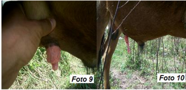
Fig. 3. Exploración a los 10 meses de operados (fotos 9 y 10)