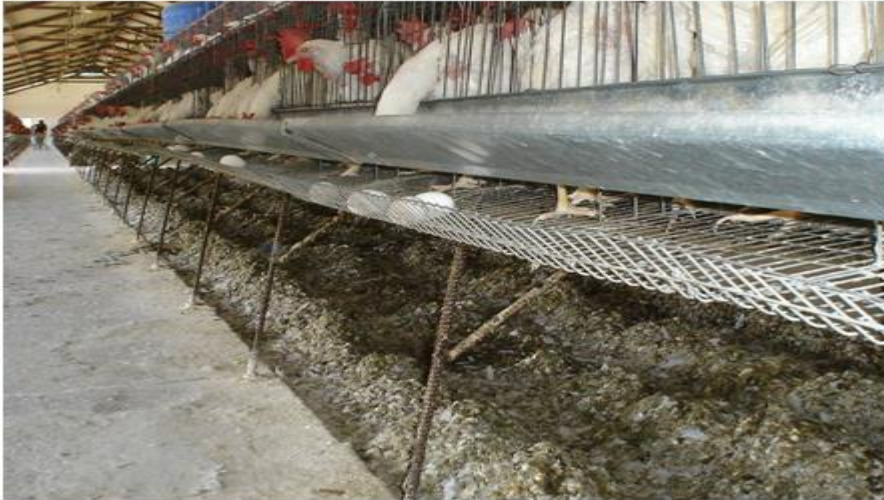
Figura 2. Acumulación de excretas (Fuente: Los autores).

Durante la producción avícola surgen una cantidad de necesidades que van más allá de los requerimientos productivos. Se hace, por tanto, imprescindible la aplicación de estrategias de reciclaje que posibiliten el saneamiento ambiental y, a la vez, permita la recirculación de nutrientes, que contribuyan a lograr un mejor equilibrio entre el hombre y la naturaleza, para alcanzar a su vez un beneficio económico con el fin de aumentar la eficiencia y productividad durante la explotación (Riaz, Wang, Yang, Li y Yuan, 2020) (Fig. 2).