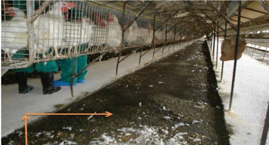
Figura 3. Excretas de ponedoras en jaula (Fuente: Los autores).