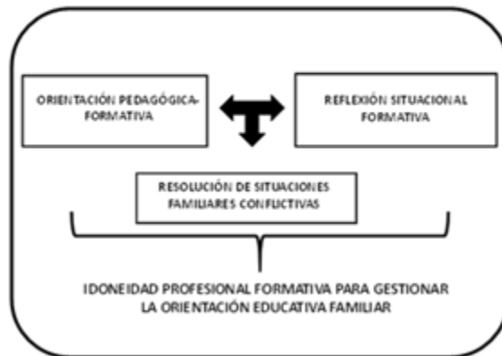
Fig.3: Subsistema procesos colaborativos de conceptualización y resolución de problemas de orientación familiar

El componente orientación pedagógica-formativa; tiene como función orientar y formar a los docentes en lo relacionado con los principios y funciones de la orientación educativa familiar y su gestión, las políticas educacionales estatales y escolares en cuanto a la relación escuela-familia y al proceso formativo estudiantil, lo que propicia que la actuación profesional profesoral esté permeada de una ética