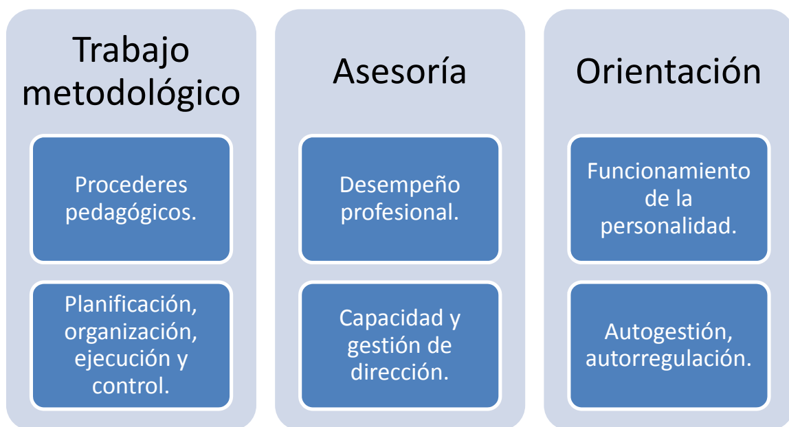
Gráfico 2: Contextos principales de actuación del Licenciado en Pedagogía Psicología

Como resultado de la práctica educativa en los últimos siete años las mayores dificultades durante la práctica pre profesional se han concentrado en la modelación de alternativas para el trabajo metodológico, la asesoría y la orientación (Gráfico 2), aspectos hacia donde deben enfocarse los planes de mejora.